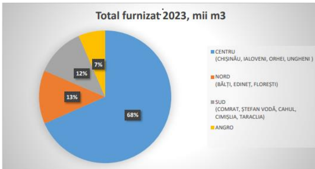
Figura 3. Repartiția volumelor de gaze pe zone de consum (an de referință 2023)